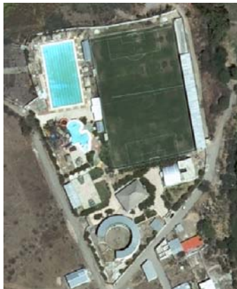
Polideportivo en Santa Catarina Mita, Jutiapa, Guatemala 15 .

En la imagen siguiente, se muestra una instalación mínima con un campo para fútbol, una piscina para prácticas de natación y para diversión, una piscina para niños, una cancha de basquetbol, un ruedo para jaripeo (monta de vacunos y equinos) y un área de restaurantes. Esta instalación mínima fomenta el deporte, la recreación y el turismo.